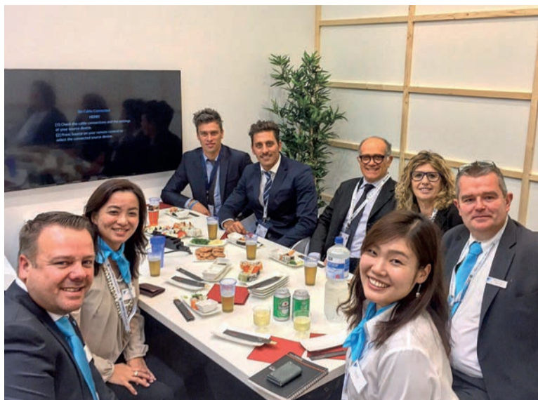
Il team di SOGESE riunisce diverse competenze nell'ambito della progettazione e dell'integrazione in ambito logistico industriale per la piena soddisfazione dei clienti